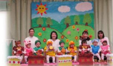
リトルフェスティバル