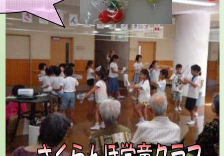
さくらんぼ学童クラブ