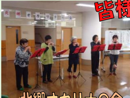
北郷オカリ十の会