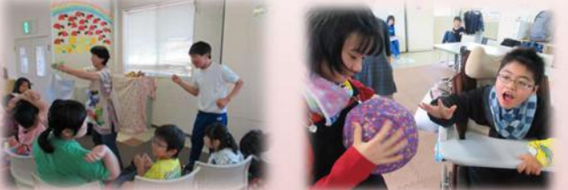
ボウリング 風船あそび