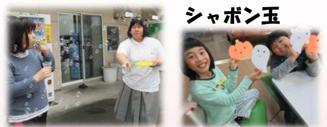
エフロンシアター