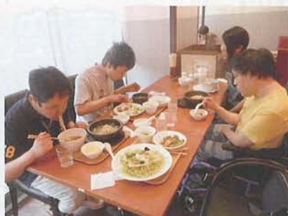
▲好きなものを注文して食べました！