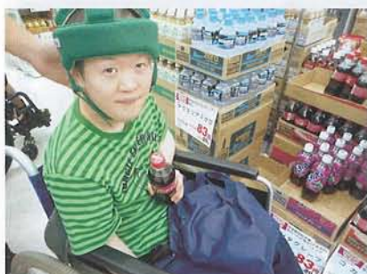
▲大好きなコーラを買いました！