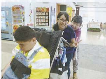
▲楽しく笑顔でショッピング！