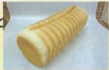
『大納言ブレッド』 380円 (ハ-7190円)