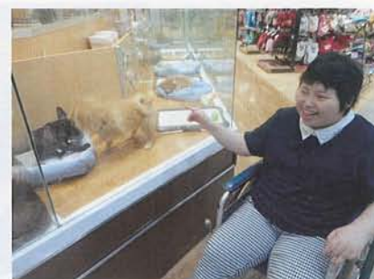
▲元気な子犬を見て大興奮！