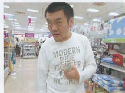
▲お目当てのものが見つかったようです！