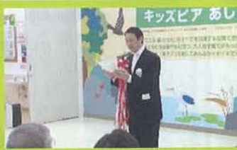
足利むつみ会理事長