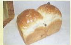
当店イバソ人気 『レーズンブレッド』 280円