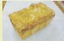
チーズやベーコンが具沢山 『オニオンブレッド』 500円