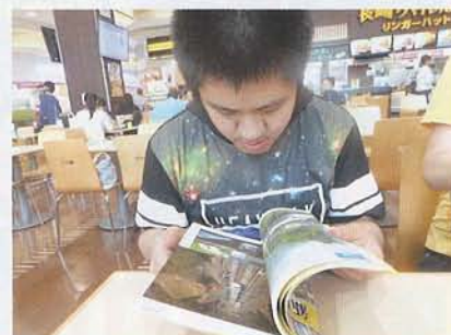
▲購入した本をさっそく…