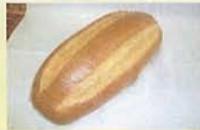
牛乳たっぷり 『ミルクブレッド』 300円