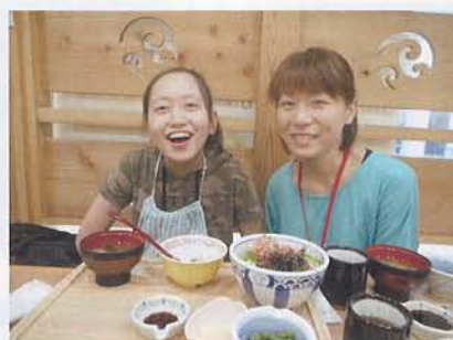
▲施設では食べられない海鮮丼を！