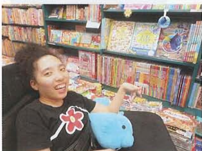
▲どれにしようかなあ～

今後も利用者の皆さん、御家族の思いを大切に受け止めて、安心して御利用できるよう職員一同連携を密にして、利用者の皆さんの大切な時間を、活動を通して有意義なものになるよう更なる努力をいたしたいと思っておりますので、御指導御鞭撻を賜りますようお願い申し上げます。