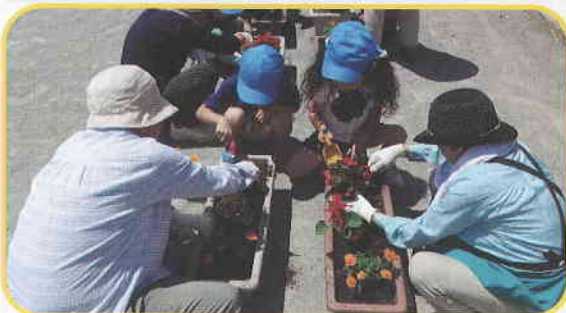
『お年寄りとの花植え』年長児や青空のご利用者・地域の老人会の皆さんと花植えをしました。