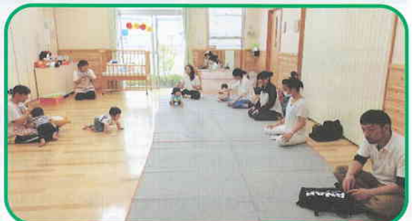
『0・1・2歳児 保育参観』保護者の方とふれあい遊びなどを行い、過ごしました。