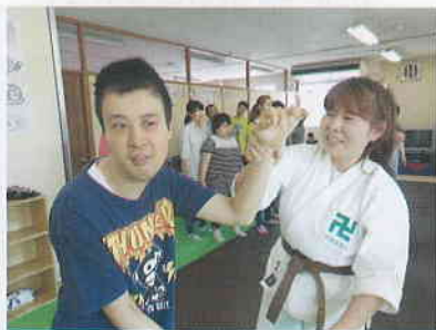
▲運動プログラム 音楽に合わせて身体を動かします!