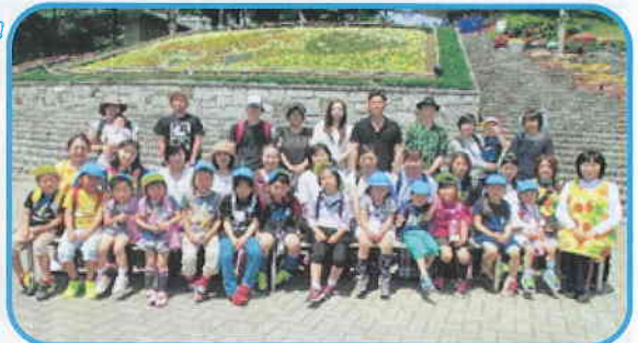
『親子遠足』那須りんどう湖 LAKE VIEWへ行きました。