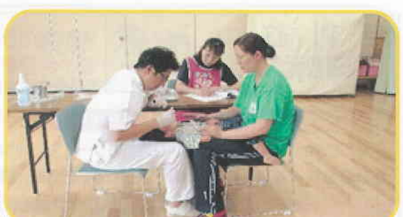
『歯科検診』（年2回実施）お口を大きくあけられるかな～？