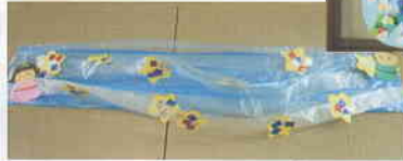
▲利用者の皆さんが作った作品の数々です!!