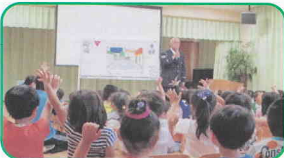
『交通安全総合指導』指導員さんから交通安全のお話を聞きました。ルール守ります!!