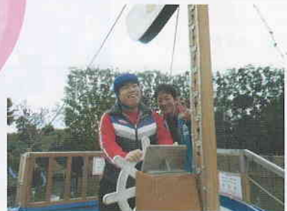
▲外出プログラム 職員も一緒に楽しんでいます!

今年度、外出プログラムでは外食やショッピング、日帰り旅行では群馬サファリパークを予定しています。普段とは違った環境で、みなさんの笑顔や楽しそうな笑い声が聞こえるよう、職員も一緒に楽しみたいと思っています。