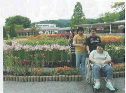
▲外出プログラム あしががフラワーパークへ行きました!