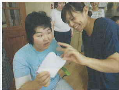
▲個別活動 それぞれが好きな活動を楽しんでいます!