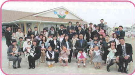
『入園式』新入児26名が入園しました。

私たち職員は、お子様方一人ひとりの成長の姿（首がすわった。ハイハイ出来た。寝返りうてた等。大きくなると、名前書けた。逆上がり・前回りできた。ブリッジや側転が出来た。そして、思いやりの心が育った。などなど…）を目の当たりにでき、大変嬉しく自分のことのように胸が熱くなります。今後もあかるく元気に園生活が送れますように、常に環境を整えて参ります。よろしくお願い致します。