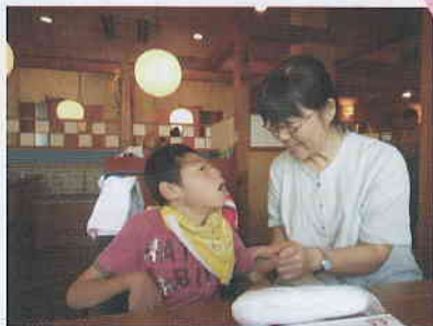
▲外出プログラム 和食屋さんで外食をしてきました!

今年度、外出プログラムでは外食やショッピング、日帰り旅行では群馬サファリパークを予定しています。普段とは違った環境で、みなさんの笑顔や楽しそうな笑い声が聞こえるよう、職員も一緒に楽しみたいと思っています。