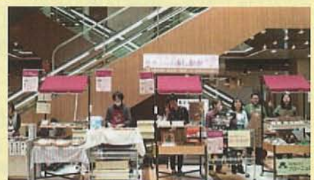
<ハートショップでの販売の様子>