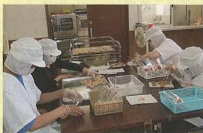
<クッキー作業の様子>

また、毎週火曜日にはハートショップとして、セルプ絆のピーターパンや他の法人施設とともに、コムファースト・アピタ（朝倉町）に出店していますので、ぜひ一度お立寄りいただければ幸いです。