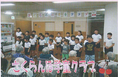
さくらんぼ学童クラブ