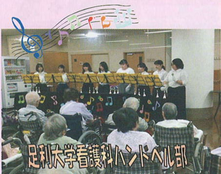
足利大学看護科ハンドベル部

今年もたくさんのボランティアの方々にお越しいただき、入居者の皆さんを楽しませてくれました。普段は物静かな入居者の方も目を輝かせ、笑顔で一緒に歌ったり、踊ったりする姿を見て、我々職員も嬉しくなり、元気を貰えるように感じます。是非、またのお越しをお待ちしております。