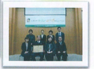
▲令和2年1月15日 表彰式 (栃木県庁にて)