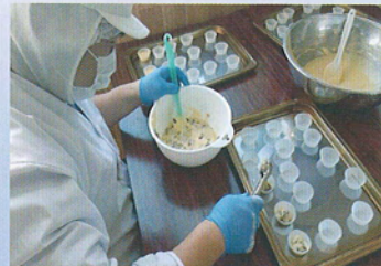
菓子製造・販売事業