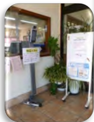
▲自動検温サーマルカメラ、 自動手指消毒スタンドの設置