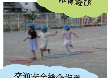
交通安全総合指導