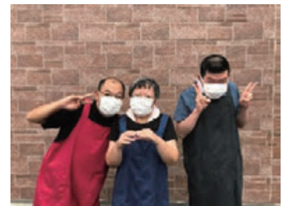
清掃作業メンバー