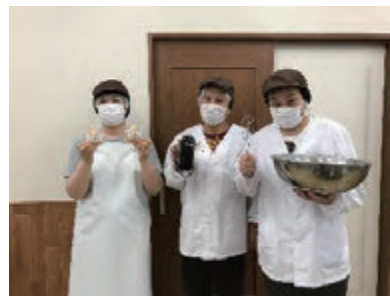
クッキー作業メンバー