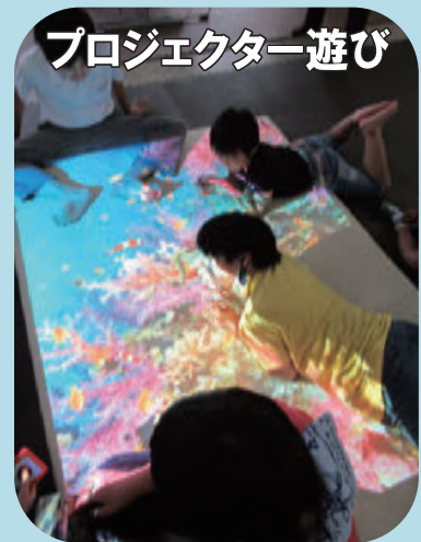
プロジェクター遊び