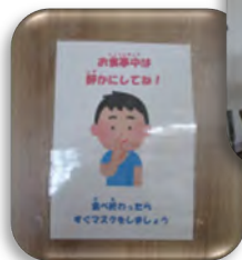
▲食堂の飛沫防止パネル設置、 利用者の皆さんへのお願い