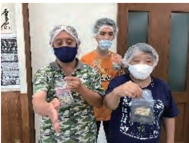
キャスター作業メンバー

施設では、継続して「手洗い」「消毒」「3密の回避」等の感染予防対策を徹底し、利用者みなさんやご家族の方に少しでも安心して頂けるよう努めていくとともに、各家庭におかれましても感染防止対策のご協力を引き続きお願いいたします。